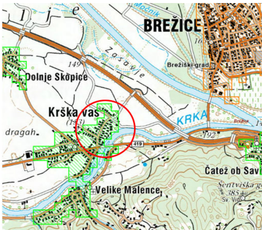
Slika 1: Prikaz območja obdelave